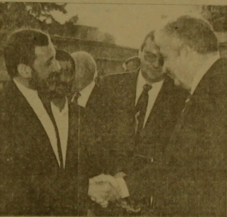
Վեյաթի - Բոլշակով հանդիպում

Հանդիպումները ընթացում են նախնական արձագանքներով, աշխարհիկ եւ երկու երկրներին անդամակցող բազմազան հարցեր: Մյուս որոշումները Ռուսաստանի հետազոտողական կազմակերպության նախագահ Ալեքսանդր Յակովևի գլխավորությամբ հանդիպումներ ունեցավ Լադիսլավ Եւ Կալինին հետ: Այդ հանդիպումները բաց կարևոր նշանակություն ունեն երկու երկրների միջև կապերի կարգի մասին խորհրդակցության եւ կինոյի ոլորտների համար: Ինչպես, դա բոլորը չէ: Մեծ ժողովուրդը, որ Յակովևի ղեկավարությամբ է ներկայացել, որով դեռ ղեկ է կենտրոնում: