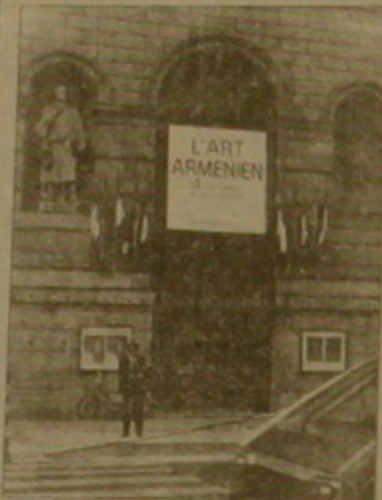
Լուսինի գեղարվեստի արվեստի քանդարան, 1970 թ

Ֆրանսիայի եւ Հայաստանի դուստրիներին, երկու Պասմուրյանների կառուցվածքների հովանավորությամբ, բարձրաստիճան Պասմուրյան անունով, Լադիկյան, մշակութային գործիչների մասնակցությամբ: «Միաժամանակ Լեոնորյուն է սա», բնորոշ էր Մարտինո Մարյանը: Իսկ Ֆրանսիացի արվեստագետ Գարբոն, որ երբևէ անվաճ ընթացում ուր անգամ այն լին քանդարան, այդ ցուցահանդեսը համարեց առաջին լուրջ Լադիկյան քանդակը: