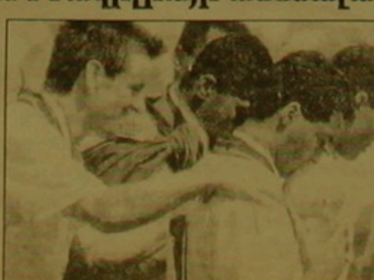
Առաջ անցնելով լողորդ Չուզենայով մոտանալ Գուսալու Բուզենից: «Ֆուտբոլ-1» բացառիկ

Բրազիլացի շուրջ 200 լրագրողներ, մասնակցելով «Օ Լուսադո» թերթի կողմից կազմակերպված հարցմանը, Ումարիտին, որ իր լիվ անունն է Ումարիտ դե Սուզա Զարիա, ծանաչեցին 1994 թ. լավագույն ֆուտբոլիստ: Ֆուտբոլիստները լավ գիտեն, որ Ումարիտն մեծ դեր խաղաց աշխարհի առաջնությունում Բրազիլիայի հավաքականի հաղթանակի հարցում: «Բարսելոնի» բրազիլացի ձմեռային միաժամանակ ճակատագրի 1994 թ. Բրազիլիայի լավագույն մարզիչ,