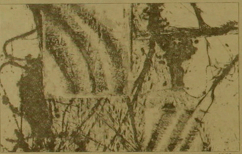
Սամվել Ասեփյան «Պատասխան քառ». 1991 թ.

ապարեզում (մասկոթես Վահե Եանիկյանի դեկորատիվային «Անանուրի քառանկի կյանքային Մարտիրոսը»): Անցած տարին նաև վկայեց այն մասին, որ մեակորային հեղինակները զբաղվում էին մեակորային հայտնաբերությունների, ուր ակնառու աղագույթն է գրողների և բանաստեղծների գործերի միություններում, այլ կազմակերպություններում չհոր ճգնաժամային իրավիճակը: Այդուհանդերձ, այն լիցիթ, որով գորացել է մեակորային կյանքը, խոստանում է չնվազել նաև այս տարի, առողիկ ես, որ 1995-ին համախառնային կինոմասնագրաչր նստում է յուր 100-ամյակը, գործնականում են ստանում Հայաստանի և Ռուսաստանի մեակորային շունդերի դաշնամակրոմադրությունները, ինչպես նաև ակնկալվում են նոր հաջողություններ միջազգային աղագույթում հասկալու կասարդական արվեստի բնագավառում: