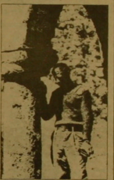
Մոյսեսյան Լ. Եւ ստեղծ մարտնականությունը...