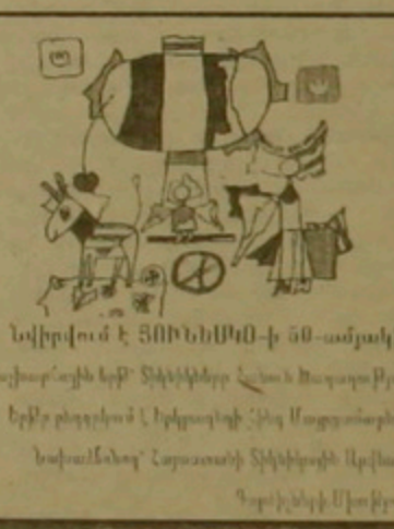
Նվիրվում է ՅՈՒՆԵՍԿՕ-ի 50-ամյակին Համաշխարհային երբք՝ Տիկնիկները հանուն խաղաղության Երբք բողոքիս է, կրկեսային ինչ Մադորի օգնությամբ: Նախաձեռնող՝ Հայաստանի Տիկնիկների միություն Գրույցի հեղինակ՝ Արմեն Մախարյան

մաներ: Սակայն ընդհանուր իմաստական դժվարությունների դասնատվ շարքային այդ երբք չկայացավ: Այնուհետև ՅՈՒՆԵՍԿՕ-ի գլխավոր ֆարսողար Ժակ Ֆելիքսը օգնության հայցով դիմեց ՅՈՒՆԵՍԿՕ, և գլխավոր ֆարսողար Ֆեդերիկո Մադորի կողմից արդեն 95-ին անցկացվելիք երբք նախատեսվելու հավանությանն արժանացավ: Հուսալի առիթ կար երբք նվիրվեց ՅՈՒՆԵՍԿՕ-ի 50-ամյակին: Արմեն Մախարյանի հետ մեր գրույցից դարձվեց, որ մայիսին սկսվող երբք-հանդեսը սակայն ՅՈՒՆԵՍԿՕ-ի հաստատության գրասենյակի մեղմ առամ անդուրջ վերաբերմունքի դրասնում ոչ միայն ուրիշ հասցե ընտրեց, այլև Հայաստանի իրեն նախաձեռնող երբք, ներկայացնելու սահմանները ներառեց հայ մարդու մասնագրում դասնատվ սուլ: (Երբի բաս են գայրակցվում ակնբարային եկամուտներ հազվելով երբք դրսից ուրեմ երախիտ սասնորյակ, բարք, սխիտում է հաճախ «ձեռագ» մի բան աղաղելով մեր