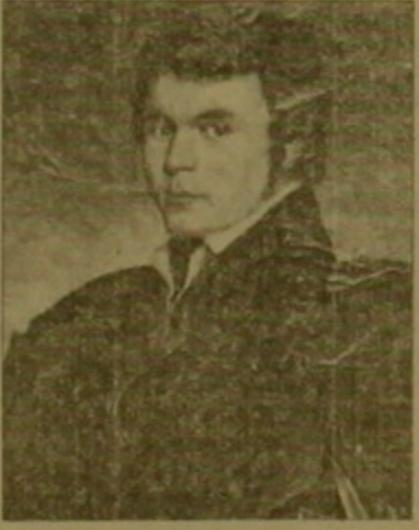
Հերան Աբովյանը Հայաստանում կասարած բրջալալությունների ժամանակ ժամոքացել էր Խաչատուր Աբովյանի

վյանի հետ և նրան մասնակցից դարձել իր գիտահանդիս: Հ. Աբովյանը կասարում էր ռուսումնասիրություններ Անդրկովկասի և Պարսկաստանի ներքալանական կառուցվածի վերաբերյալ: Նրա խնդրանքով, Խաչատուր Աբովյանը Երևանի գաղտնական ուսումնարանում կազմակերպում է օղերեւութաբանական դիտարկումներ, իսկ Երևանի կլինիկային նվիրված հողվածն ողալում է «Կալկազ»-ի երբի խմբագրություն: Աբովյանի կազմած դրոշմի տարևական հազվակցությունից երեւում է, որ անց են կացվել «օղերեւութաբանական, ձեռնարակալական, չեմալական և խոնավալալական» դիտարկումներ: Այստիպով, վաստաներ կարելի է ասել, որ լուսալուրի Խաչատուր Աբովյանը եղել է Երևանում մասնագիտական գործիչներով առաջին օղերեւութաբանական դիտարկումներ կազմակերպողը: ԱՏԵՓՈՒ, ՊԱՐՈՒԿՅԱՆ