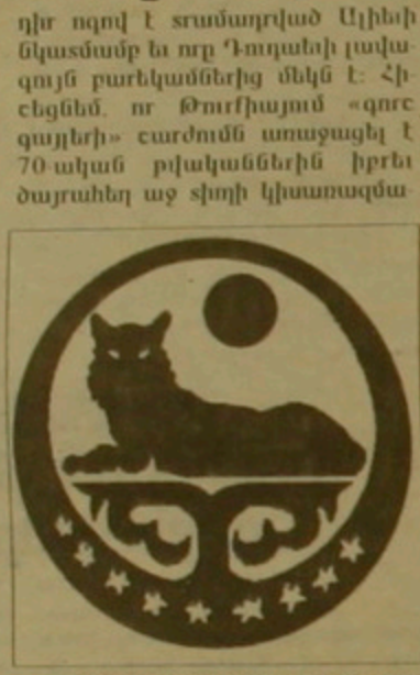
Չեչենիայի նոր զինանշանը միայնակ գայլը լուսնի ներքո

ԼՈՒՍՈՒՎ ԿՈՒՆԿԱՅԻՆ Սեփ. քրքրակից, Մոսկվա Գողգոթական վարչախմբին թուրքիայի կողմից ցույց տրվող ռազմական օգնության մասին գործնականում սկսել են խոսել չեչնական դասերագմի ամենակարգից: Այս կառավարչությանը հիշատակվել է «Գործ գայլեր» բառով, որի հիմնում ընկած է ազգայնական վարչախմբային ի հակադրություն խաղաղության: Ինչպես հայտնի է, բյուրեղյակ երկրներում գայլը առկա չէ, այն անհայտ է: Օրինակ, բուրձնաքանդակները Կիտրոսում կույրների դեմ ուղեւորվում էին գործ գայլի դասեր կողմ դրոշմակ: Իսկ երբ սարի առաջ համախառնային ընկերակցության կողմից չմանալված այս տեսությունը Հյուսիսային Կիտրոսի թուրքական Հանրապետություն, այցելեց ինքը Ջոհար Գողգոթ: Այն ժամանակ մոլորակները սեղանական ընկերությունը մեծ գործ գայլի գինեւորումը նվիրեց: Իսկ Գողգոթի Կիտրոս այցելեցուց հետո Իչկերիայի դրոշի վրա հայտնվեց գործ գայլը: Այդ ժամանակ իր նոր բարեկամներին նա ասաց. «Երբ երբիցս դուք մեծ վիճակի մեջ հայտնվեցե՛ք Կիտրոսում եւ իմ կարիքն ունենա՞լ կանչե՛ք ինձ գայլավարի եւ ես կգամ»: Սակայն, բոս որոշակիաների, հենց բուրեղյակ «գործ գայլերն» են ռազմական օգնություն ուղարկում Չեչենիա իրենց աղբյուրների գործընկերների միջոցով, որոնց առաջնություն է ներկին գործերի նախկին նախարար Իսկանդեր Համիդովը, որն ընդդիմա-