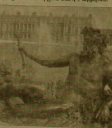
Վերսալի ճարտարապետական կորոններն էլ իրենց ռեժիսորությունը ետին բախված բազմաթիվ խնդիրներ ունեն։ Դրանցից մեկն է Վերսալի նշանակումը դարձալի ներկա վիճակի եւ վերանորոգման հեռավոր ծրագրերի մասին էր դաստիարակ լրագրող Բերի Տեյմսը «Ինքնընթացող հերթի սփյուռք» քերթում։