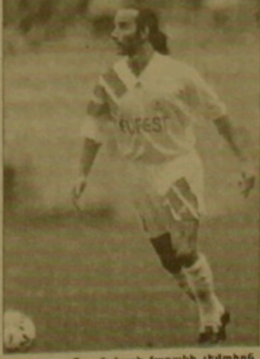
Ցրանսիայի Կոսայի թիմի «Մոնակոյի» դաշտային երկու ԳՂ ՍԵՆԵՆ, որ «Մոնակոյի» առաջատար խաղացողներից մեկը Զորի Տերկանի Գարի Սեն-Բրանն:

դա-96»-ի ընտրական մրցաւարում նույն խմբում ընդգրկված Բելգիայի հավաքականի առաջատար Էնցո Հիֆոն երեւանյան խաղից առաջ առաջին անգամ հնարավորություն ունեցավ ծանոթանալ հայ խոսրոյիսների հետ, քանի որ վնասվածի դասճատով չէր մասնակցել: Բրյուսելում կայացավ Բելգիա-Հայաստան խաղին: Ծոսրոյասները հավանաբար տեղյակ