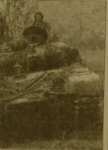
զինվորական դիտողները դեռ չեն ճշտել, քե արդյոք դա նախաձեռն է, քե՛ վերադասավորում: Ռոու վերոնկարները գտնում են, որ խորվաթությունների նման զարգացումը Կրաինայի սերերին կստի ճանկ բանակցությունների սեղանի շուրջը: Չագրեթում ՄԱԿ-ի ներկայացուցիչները խոսում են Բունիայի եւ Կրաինայի սերերի դիրքերի վրա խորվաթական բանակի հնարավոր լայնածավալ հարձակման մասին:

չի կառավարության մասին հարտդարի հայտարարության համաձայն, Չագրեթը երբեք բայլ չի տա: Կրաինից բացի, միջնասարածիր բնակչությունը կազմում է մոտ 260 հազար մարդ: Տարածքի անկման դեպքում այդ մարդիկ կզգան դեղի Խորվաթիա, որն ի վիճակի չէ ամենին ընդունել: Ներկայումս այնտեղ արդեն կուսակցվել են մոտ 400 հազար խորվաթ զորավորներ: Վերջին հաղորդումների համաձայն, Կրաինայի սերերը սկսել են հեռանալ իրենց դիրքերից, բայց