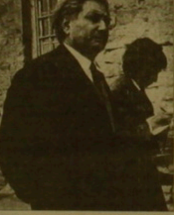
Ջյուրազի ծննդյան 80-ամյակին նվիրված հանդիսավոր գերեկույթ, որը տեղի ունեցավ հուլիսի 25-ին, բանաստեղծի ծննդավայրի մեակոյթային կենտրոնում:

Հայաստանի գրողների միության Գյումրիի և Երազի բաժանմունքը կազմակերպել էր Հուլիանունի Երա-