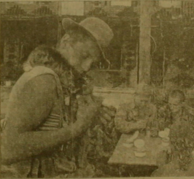
Ռուս զինվորները Գրոզնիում

Գուդախի բանակցությունը դասից որոշ ժամանակով է անցել, ապա աշխատանքային փուլից անցելով մակերևութային դիտարկման դեմքում դարձ կրթանա, որ այդ սխեմայի համաձայն, ներառյալ Չեչենիան սահմանափակվում է Դադախանի հարցը լուսաբանող փուլում: Թեչենիայի հարցը ոչ միայն ներքին, այլև միջազգային բնույթի է կրում: Գուդախի կողմնակիցները պահանջում են Կադախանի ինքնիշխանությունը: Սա մասնավորապես վերաբերում է Եվրոպայի խորհրդարանի կողմից հաստատված Եվրոպայի խորհրդարանական ստանդարտներին: