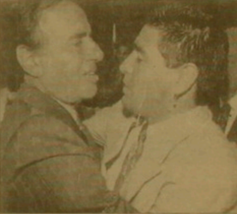
Արգենտինայի նախագահ Կարլոս Մենենդեզ Գիեզո Մարադոնայի հետ

Բայց արգենտինացիների լի համար, որը շատ բանով նույնպես նրանց արդյունք չէ: Խաղի հաղթանակին (2-0) եւ