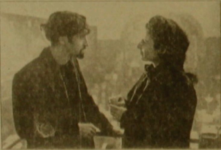
Կարգ - Աղանազագրության գործակալը - ֆիզիկոս

ված են մի Խանի տղով քննարկողներին դասնել ինչպիսիքություններ: Ասումում հետևած լինելով կինոարվեստի ճարտարություններն քաղաքականապես դասադասված էր քննարկելու Էդդայնի ներկայացրած ժանրն ու դասնելի ոճը: Պե՛ս է անմիջապես խոստովանել, որ մեր առջև կանգնած է բարձր մակարդակի մի արվեստագետ, որ չխորհելով հանդուգն կերպով խոսելու մեր դարի աննասարքե, ավաղ սակայն նաև աննազգրկելի երևույթների մասին, չափազանց ինձնուրյն մոտեցում է գրգռելուց դրանց նկատմամբ և կարողանում համոզիչ հանդուգնություններով մինչև վերջ հասցնել մեկ առաջարկված նյութը: Նրան մասնագործը կինոնկարում քննանկան օրայն է, քննանիկ հասկացությունը սրբությունը, քաղաքականությունը, քննանիկ անդամները հավասարությունն ու նվիրվածությունը մեկը մյուսի նկատմամբ: