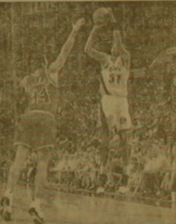
Երեք միավորանոց բարձր արդյունավետություն է արձանագրել: Կանոնակարգի այս փոփոխությունը մեծադրաբար բարձրացրեց հանդիսատեսներին, որոնք վրա են լինում արդյունավետ

խաղերի: NBA-ի առաջնությունը ավելի շատ շուկայան է: Ուստի նրա կազմակերպիչներն ամեն ինչ անում