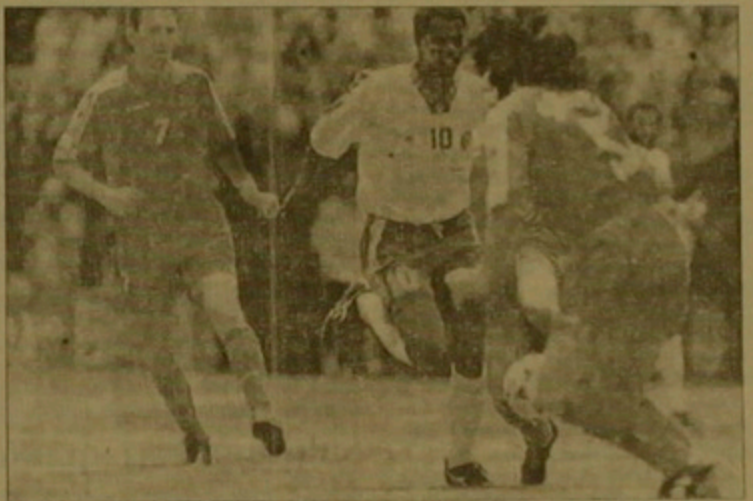
Ալ Օվայրանի թագավորական ուղերթը դեպի Քեյպթայի հավաքականի դարձած դաստիարակները

(Մարոկկո): «Hyatt ReGENCY» շինարարական ընկերությունը Օվայրանը 15 օր շարունակ զվարճանում էր: Խնդիրն ազգային մեծ բնույթ ստացավ եւ գրգռեց ղեկավարներից մինչեւ Ֆահիլի թագավորը: Երբ Օվայրանը վերադարձավ Ռիյադ, նրան 3 ամսով զրկեցին ֆուտբոլ խաղալուց: Բայց Օվայրանն օգտագործեց իր ազատ ժամանակը՝ 500 հազար դոլարի դաշնամագիր կնքելով Չիկագոյի Reebok Ֆիթնեսի հետ: Այս անգամ, երբ Օվայրանը վերա-