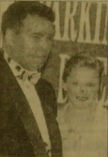
Կասիուս Բելլը և Մարգարեան

Բոլոր ժամանակների աշխարհի լավագույն բռնցքամարտիկ Կասիուս Բելլը (Մոնթանո Ալի) սառածում է Պարկինսոնի հիվանդությանը և դասադարձված է մահվան: Անբուժելի այդ հիվանդությունը կարծում էր մոլորի քիչների անբավարար գործունեության հետ: Կասիուս Բելլը դադարում է այս դժգոհ հիվանդության դեմ: Կազմակերպելով բազմաթիվ բարեգործական կարգեր ֆինանսավորելու իր կողմից ստեղծված այն կազմակերպությունը, որը գրադրում է վերստի լավ հիվանդությանը սառածություններն օրվա և գիտական ներազդանքներն հարգելով: