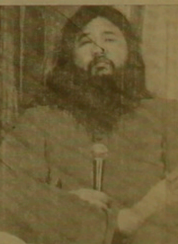
խան, մեղադրյալին սղանում է մախալործի:

ՏՈՎՈՒ, 6 ՅՈՒՆԻՍ, ՌԵՎՈՒՄԱՐԵ: Այսօր Տոկիոյի դատարանում «Անմ սերբերը» կրոնական աղանդի առաջնորդ Միոկա Ասահարային դատարանում սղանության եւ մախալործի մեղադրանք ներկայացրեց մարտի 20-ին Տոկիոյի մեռոյում գաղային հարձակման անցկացման համար: Համանկման մեղադրանք ներկայացվեց աղանդի ղեկավարության եւս 6 անդամների, իսկ մախալոր զարին գաղթ արարողությանը մասնակցած աղանդալորները մեղադրվում են սղանության նախարարատման մեջ: Տեղացի մեկնաբանները նեում են, որ մեղադրյալների դատարանությունը կսկսվի աեմանից ոչ օրս եւ կարող է տեղ արիներ, կր Ասահարան շխտարանի իր մեղքը: Դատարանայի օրեններին համադատասա-