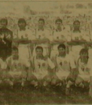
Բուդապեշտի հավաքականը Երևանում

աղիսողներ՝ հեճադեղում կան նույն ժամանակ (հանդիպումը Երևանում սկսվել էր Բուդապեշտի ժամանակով 16:30 ին)։ Չարքեղուց հեճո նրան իմացան, որ