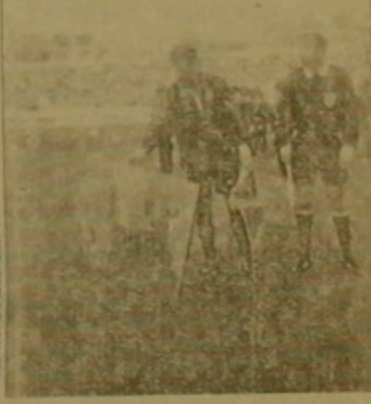
ՄԱՍԿՎԱՅԻ ԳՈՍՏԱՅԻՆ, 1994

Անդրեյ Մոսկվայի Բաղանական հավաքականի կազմում միջակային 100 հանդիպումների առաջ