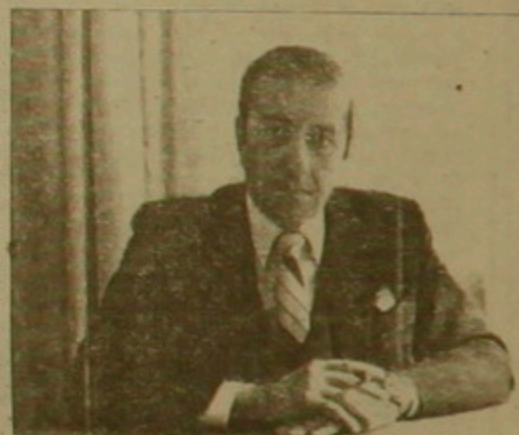
Վրան վրացիները 10-15 արի ա տաչ, մեմե չունեցանք, եւ դասճաղ ոչ քե լեզուն է, այլ քեմ րարճրանա յու վախը. նաեւ այն դարսաղի ր ազասուրյունը, առանց որի Լասրաղա լինել չի կարող: Հայր չունի այդ ներին ազասուրյունը, ուրեմն ինչ ոլի՞ս ոլի՞սի Լասրաղա ներկայացնի: Գարի Արվազյանի կարճիին ոչ այնինքն համամիջ լինելով համ նայնդեղեսուր իրենեմ, որ մասնագեճ մարդու, Լասրաղային երաճարյուն ենդինակող կամողղվեսուր կարճի է: «Ես գրում եմ այն երաճեսուրյունը, որ լավ մեջ լսում եմ ու չեմ կարող չարսահայել: Իսկ երգչուհիների համար անում եմ ամեն հնարալու րը, որ ազաս լինեն»:

ռով մեկ մեկ ժոռանում ենք, քե ինչ ասել է երաճեական րարկես, իսկ դակիճում աս հանախ կասկա ժում երկոսանի ի՞նչ ենք: «Կամեր սոնի» հանդիասեստին մեր ներկայացումները կօզենն ազասվել նման հարցերից, կօզենն ոզաս լինել:» Ճրասրոնի արխա սի ախասալարճը 2 հա արից 12 հազարի ասի մաններում է: «Կամերսո նի» գեղարվեստական ղե կավարի րացաարու րյամբ, այն հնարավորու րյուն կսա լավ ախասա յու, իսկ րարճրամակար րակ ախասանի դիմաց լավ վճարումը կօզնի եր վելու ողանին հազ ճարե յու մասին չճսածել: Ներ կայացումների տոսի միջին ղինը սասնանված է 400-500 դրամ, որի եկամտը առաջին ներին կփակի դակիճի վարճը: Հովանալորներն մասին խոսելիա դարոն Արլա ղյանն ասազ, քե նրանց միջոցով իրեն ոսի կկանգնեն, քայց նորում երկրներում արվեսագեճին գճնում է ղոճարար մարդը, առաջարկում համագործակցել ճճում հաւալելով նաեւ դակիճում ներկա գճնող այն մարդկանց հանսղը, որոնք ներկա յացման ժամանակ կճարտրանան իր ֆիմայի հետ, իսկ հայրող օրը միգրոցի փեսուն իր գրասենյակը: Այդոլիսի գորճարարը ճճարիս ար վես հովանալորելով ոչ քե կոց նում, այլ գճնում է: «Կամերսոն» իր ներկայացումներն ժամանակ աղսսում է նոր գորճարները: