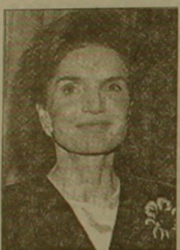
Ժին Բենեդի Օնասիսը գրադվում էր հրատարակչական գործունեությանը:

ՆՅՈՒ ՅՈՐԷ, 20 ՄԱՅԻՄ, ԻՏԱՆ-ՏԱՍՍԱՐՄԵՆՊՐԵՍ: Հիմնադրող օրն այսօր, 64 տարեկան հասակում ավաչյին համակարգի խոցելից մահացավ ԱՄՆ-ի նախկին առաջին տնօրէն ժակլին Բենեդի Օնասիսը: Նրա կողմին էին գովակները Բեռլինի Բենեդի Շուրբերգ եւ Ջոն Բենեդի Կրստերը, ընտանիքի մյուս անդամները: Ժակլին Լի Բովիերը ծնվել էր 1929 թ. հուլիսի 28-ին Մաուրիանդի-բուում (Նյու Յորքի նահանգ): 1951 թ. նա ավարտել է Ջորջ Վաշինգտոնի անվան համալսարանը: Նույն տարվա մայիսին առաջին անգամ հանդիպել էր երիտասարդ կոնգրեսական Ջոն Բենեդիին: 1953 թ. սեպտեմբերի 12-ին 24-ամյա ժակլինը ամուսնացել էր Բենեդիի հետ, որն այն ժամանակ արդեն 36-ամյա սենատոր էր: 4 տարի անց ծնվեց դուստր Բեռլայնը, 1960 թ. որդի Ջոնը: 1960 թ. նոյեմբերի 8-ին Ջոն Բենեդիին ընտրվեց ԱՄՆ-ի 35-րդ նախագահ: 1963 թ. նոյեմբերի 22-ին նա որբերգաբար սպանվեց Դալլասում: 1968 թ. հոկտեմբերի 20-ին ժակլին Բենեդին ամուսնացել էր հույն միլիարդատեր Արիստոս Օնասիսի հետ: Վերջինս 1975 թ. մահացել էր: 1979 թ. վականից ժակլինը ապրում էր Նյու Յորքում: