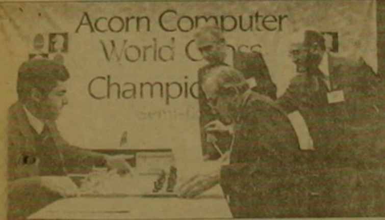
Վիկտոր Կորչնոյը աշխարհի առաջնության հավակնորդների կիսաեզրափակիչ մրցամարտում Չարրի Կասաղարովի դեմ

բանոն, որի մասին, ցավով, զիր չգրեցի... - 1990-ին ես Նովի Սաղի Օլիմպիադայի ժամանակ խոսեցի Միխայիլ Տալի հետ, որը մտնում էր Կարողովի քիմի մեջ: Ես կեսամբեցի նրան, նկատեցի ունենալով Մերանոյի մրցախաղը: Նա ուներ բախ սվեց եւ ասաց, «Բազիլոյում մեմբ բաց էին վախեծում, որ, երբ դուք բախեմ, մեզ բողրիս կոչնչացնեն»: - Չեք այժմյան հարաբերությունները Կարողովի հետ: - Դիվանագիտական: Մեմբ բարեւում եմ իրար, խոսում ինչոյես իչ ճանոր հարդիկ: - Իսկ Կասաղարովի՞: - Խոսում եմ հիմնականում դարճաների վերդումության ժամանակ: Մի ժամանակ եղավ նաեւ