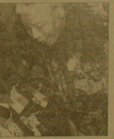
Երկրամասում և Գյումրիում հազվադեպ են հանդիպում հայերի և ադրբեյջանցիների միջև:

ՊՐԵՏՆՈՐԻԱ, 2 ՄԱՅԻՍ, BBC, WSJ Չուրոջա Կիարկություններից հետո