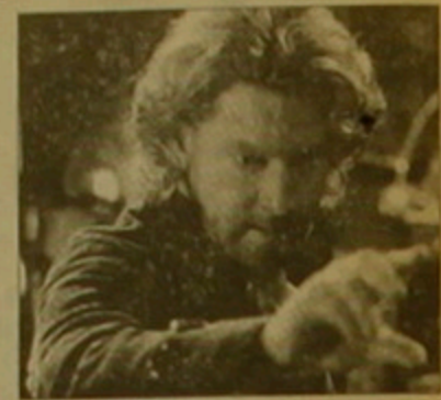
Ֆելիսմեյրով եւ բեմադրողի երեսակալության անմասարքեր դրսերում ներով հարուս կիննուկար:

Չորս ամիս տեղի նկարահանումներից հետո, անգլիացի արդեն նեանակոր երիտասարդ բեմադրիչ Քեմեյնը Բրանսլոգը («Պիսերի ընկերներ»), «Ոչնչից մեծ աղմուկ») ռուսով կավարտի դուկսոր Զրանկենեսյանի մասին իր նոր ֆիլմը, որ կոչվում է «Մերի Ելլեյի Զրանկենեսյանը»: Ինքն էլ գրադեցնում է գլխավոր դերը, իսկ դուկսորի ասեղծած հերոջ մարմնավորում է Զրանկենեսյանի դերասան Ռոբերտը Նիլոնը: