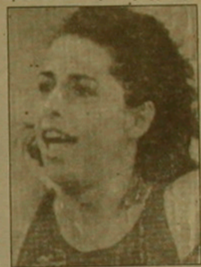
Չորս Պունասլիկին: Պասուլիդուի հավաստ է իր աստից: Նա քիկունում կանգնած են 10 մլն հույներ, որոնց համար օլիմպիական հաղթանակը բացառիկ նշանակություն ունի, կաղված այս երկրի դասնություն հետ, երկիր, որը հնարեց օլիմպիական խաղերը:»

Վաղան, Բրանսիա Բարսելոնյան օլիմպիադայի 100 մ. արգելախաչի շեմոլիտների Պասուլիդուի հետ, որն իր հայրենիքում Հունաստանում, ազգային հերոս է դարձել, որոշել է ուժեղ վարձել հեռացակի հասկանում: Նա արդեն մասնակցել է Փարիզի «Բերսի» մարզադաշտին մեկ ունեցած ծածկված մարզադաշտների եվրոպայի առաջնությանը: Հիճեցնեմք, որ Պասուլիդուի անհնազանդակ հարթահարեք արտա մարզիկներն օլիմպիադայում: Երեւի բաները հիշում են, որ վերջնագծին մեկ մեք մնացած մրցավազը գլխավորող ամերիկացի Գայել Դիվերսն անտարակիտներն զեֆին տալով եւ առաջին տեղը բաժին հասավ մինչ այդ բաներին անհայտ հունաստանցի արգելախաչողուհուն: Օլիմպիական ոսկե մեդալից առաջ Պասուլիդուի միակ հաջողությունը եղել է Միջերկրական խաղերում, որտեղ նա գրավել էր առաջին տեղը: Բարսելոնայի խաղերից հետո, Պասուլիդուի այլևս ոչ մի հաղթանակ չարտա: Լուրեր էին դրսևում, քն իր օլիմպիական շեմոլիտների, ամեն ինչ մի կողմ բողնելով, Միացյալ Նահանգներ է մեկնել ամերիկացի մի միլիոնատերի հետ: Ինչն Պասուլիդուի, հերեց այդ լուրը, հայտարարելով: «Օլիմպիական իմ ոսկե հաղթանակից հետո, ամբողջ Հունաստանը ցնծում էր: Ես առաջին կինը եղա Հունաստանից, որ քերեւ ասլեֆիկայի մրցումներում օլիմպիական ոսկե մեդալ էր ստացել: Մա մեծ նշանակություն ունեւ Հունաստանի