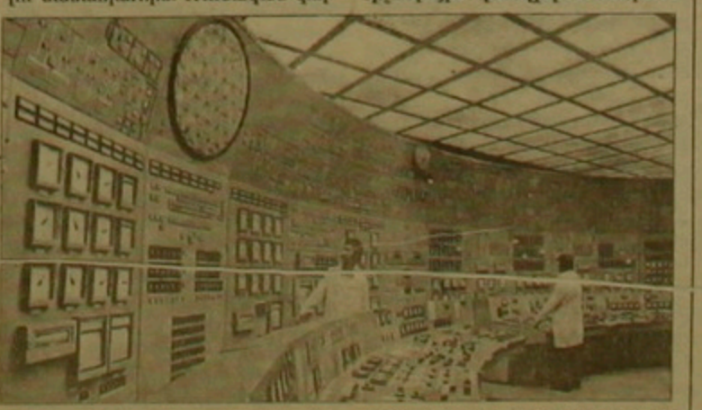
Միջ ողայմանաղղիլ ասոնագրեց աղաղին փողաղաղաղղեղ Օղղեղ Մոսկովեղղ: Եւ այսղես, բաւ ողայմաղղումը, Հայաստանին օգնելու է միջուկային Լեճղղղայի ղեկավարման գործում եւ այլն: Տեղ # Լը 2

ղիլ համարեղղ այն կարեւորագույն ֆաղղերից մեկը հանրաղղեւսության է ներգեղիկ ճղանճաղղը հաղղաղաղեր ճանաղղարիին: Ռուսական կողմացի, օղղակաղան կողմն իրակաղանցնելու է աւխասունների ինճեւսեղեղիկական աղաղաղղումը, միջուկային վաղղղիլ մասակաղաղանցի, օղղակաղան կողմն իրակաղանցնելու է աւխասունների ինճեւսեղեղիկական աղաղաղղումը, միջուկային վաղղղիլ մասակաղաղանցի, օղղակաղան կողմն իրակաղանցնելու է աղաղղեղ, որ աղաղին աւխարանմարտի տարիներին այս տարածքում տեղի է ունեցել խաղաղ ընակաղղյան ընթացքում, այլ ոչ թե «փոխաղարճ կոտորածներ», ինչդես սիրում են ողղել գեղաղաղանության իրողության դեճ հանղես եղող բար «ղեւսականները»: