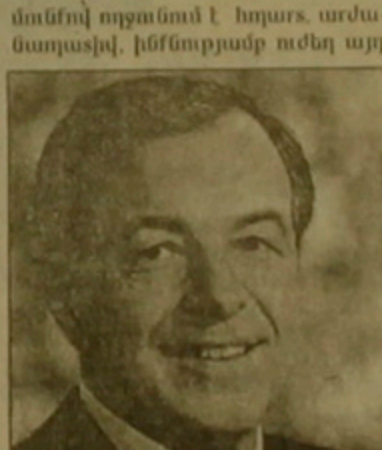
4 ղեկությունների մուտք, որոնք Երա խորապես կառված են մայրամասի դայմությունը եւ որոնց մեր հայրենակիցներից Երան արդեն Համայնի անդամ էին համարում...

Ինչոյես որ նախկին 12-ի համայնի համեմատությամբ 15-ի կամ 16-ի Եվրոպան աշխարհագրական եւ ճեւակորային առումով կլինի ավելի խայտարեց, բայց ընդհանուր կանոնների կիրառման Տեսակետից համեմատաբար ավելի միասար: