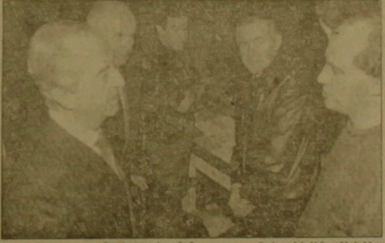
ՈՒՅՑ փետրվար 4 Բալադյուրը բանակցում է ձկնորսների հետ:

Ըստ նույն գործակալության վերջին 20 ից ամսյին անգամ անցած տարվա մեջ, Բալադյուրի ժողովրդականությունը ընկավ նախ 7, ապա 9 կետով, միանգամից հասնելով 46 տոկոսի: Մյուս կողմից, CSA սոցիոլոգիական հաստատության և «Պարիզի» օրաթերթի համատեղ կատարած «Հանրապետության նախագահության հայտը ընտրություններին (1995 թ.) ու՞մ ե՞ք հարմար տեսնում» հետազոտության արդյունքներով, վարչապետ Բալադյուրը, դարձյալ ամսյին անգամ, բաժնի է 46 տոկոս: