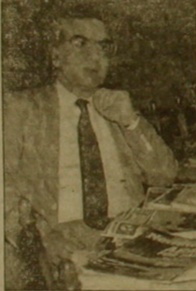
Ուսմանը այլևս չի առաջարկում:

- Անցած տարի դուք նույնպես այցելեցիք Թուրքիա, ես էր չեն սխալվում, այն ժամանակ որևէ կի բարեօրոշակություն էր նկատվել Թուրքիայի դիրքում: - Իհարկե, սկզբունքային հարցերում որևէ դիրքորոշման փոփոխություն չի կարելի ակնկալել, բայց զոնն հակամարտության ճիշտ ընկալման մեջ որևէ տեղաշարժ կատարվել է: