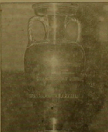
Փոխանցված գազաքար, որը հանձնվում է Եվրոպայի չեմպիոններին

Եվրոպայի չեմպիոն Գանիայի հավաքականը ճամբարում մասնակցեց միջազգային մրցաժամերի և եզրակազմի մրցումներին: 2-0 հաշվով հաղթելով Գանիային նվաճեց առաջին մրցանակը: Գոլակները խփեցին Բրիտանացիները և Ֆրանսիացիները: Մրցաժամերն անցանկյունում էին նաև աշխարհի առաջին առաջնության կազմակերպիչ ԱՄՆ-ի, ինչպես նաև Ռուսիայի հավաքականները: Երրորդ տեղի համար այս քիմերի մրցումներում 2-1 հաշվով հաղթեցին ռուսները: