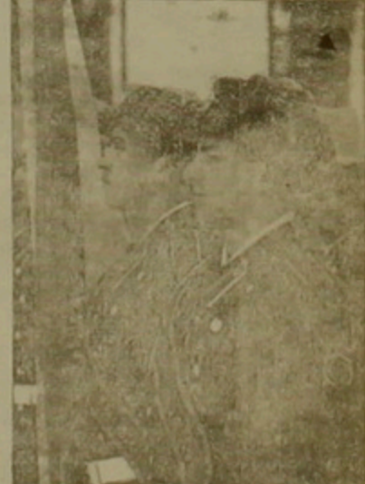
Ըստ «Վաշինգտոն փոստի», 12 միլիարդի փոխհատուցումը մեծամասամբ դիտել օգտագործվի Ուկրաինայի արտադրողական հիմնարկները հետազոտելու փոխարեն, դիվար քե կիտը բուսական օրեալ գումար ստանալ:

ԲԱՅՔԻ ՏԵՐՄՈՆ ԱՐԱՐՍ Մեր սննդի, բոլոր ֆորիզ վերջերս ամերիկյան ու եվրոպական մամուլը առաստծեմ անդադարում են երկրորդ նախագահ Քլինթոնի մի քանի քարի առաջ ունեցած սիրային խաղերի մասին, մասնավորաբար բացատրելով գիտնականները գլխիկները ասող Ջեմի Բլաուերի հետ նա 12 տարվա հարաբերությունները, գայթակղությունների դաշտայիններով սերելով բաց թեյան ես նոր գրքիկների կատարած արձանագրությունները, որոնք նախագահ Քլինթոնը դաշտայիններով է քաղաքացիների դուրս գալ դեղի Արևելյան եվրոպա, մի այլ դաշտային, այս անգամ 12 միլիարդ դոլար արժանությամբ, գալիս է ծածկելու այդ գայթակղությունը: