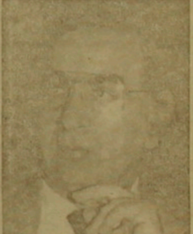
Ներ է ոնեցել Իրանի նախագահի սեկետական հարցերով սեղակալ Մոհսն Նարթախի և նեանկելու Մեղի-Նուրուղ հիմնական կամրի շինարարության հարցը: Այնուհետև Ժիայր Լիղաիսյանը հանղիղել է Իրանի Մեղիսի փոխնախագահ Հասան Ռեանիի հե, որի րնրացում նեանկելի է հայի-րանական միջխորեղարանական հարթերությունների գարգաման հարցը: Դրն, Լիղաիսյանը հանղիղումներ է ոնեցել նաե Իրանի Էկոնոմիկայի ե Դինանսների նախարարի սեղակալ Մեղի Նավարի, Թեերանի Հայոց րեմի առաջնող, գերաուրի Արակ արկղիղոյուս Անուակային ե րեմական խորղի անղամների հե: Իրանի Իսրանական Հանրաիսության արթործնախարար Ալի Արար Վեղայարիի հե հանղիղման րնրացում որն, Լիղաիսյանը րեաղիկել է Հայաստանի ե Իրանի միջու ներկայումս հարաբերությունների, դարարադյան կիմնահարցի արղաական կարգավորման հե կաղղված հարցը: