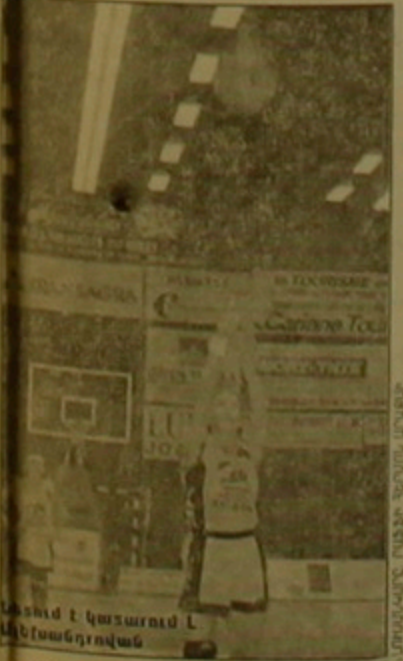
Մեծ խաղում Լ. Անասյանը

ԱՆՈՒՆ ԲՈՅԱՆՅԱՆ Սեֆ. ԲՈՅ. Փարիզ Մասկեթովի կանանց Ժրանսիայի առաջնության 20-րդ մրցափուլում «Մերն-Լուան»-ը, որտեղ հանդես են գալիս հայաստանցի 2 քաղաքացիներ, Լյուդով Ալեքսանդրովա-Քոչարյանը եւ Անահիտ Հարությունյանը, հյուրընկալել էր իր մասնակցողներին «Մոնֆրանս»-ը: Մղավում էր, որ ճակատ