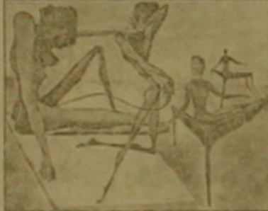
Մոմ է Գալիի նկարչությունը...

ներից ու ինստալացիաներից հեռու է, գուցե եւ երբեք էլ չդառնա նման գործերի հեղինակ, բայց նրա նկարչությունը սյուրռեալիստական մակարդակներից հավելում է դեմի կոնցեպտուալը. «Կարող է Մարկոպոլո Գալիլեյի նման լինել, բայց դեմի իրեն չնմանում, ինչո՞ւն ասեմ, դրա ես գալիս առաջին բառերը գրելու եւ դրվում ես առաջին ուսուցչի նմանակմամբ: Ի՞նչ գործեր սյուրռեալիստական չեն: Նախ, ինչու դեմ եմ քո յուր սեռակի իզմ երին: Իսկ երբ սյուրռեալիզմը ենթագիտակցանի եւ ինստալացիայի խառնուրդն է, աղա վերջին հավելում նման գործերը հաստատան անալիզի չեն ենթարկում, իսկ ես ենթարկում եմ... Եսեմ, մեկը խնձոր է նկարում: Գա ի վերջո խնձորը չէ, ընդամենը կլեյնն է: Բայց նրա մեջ հյուր կա, կարող է եւ որդ լինել, ենթագիտակցություն կա: Ինձ հենց խնձորի ենթագիտակցությունն է հետաքրքիր: Ի՞նչ աչքն խնձորաբանական խնդիր է հայտնվում, որդ դեմ է լուծել սկսած խնձորի մաշից, մազուցից, խնձորի դիզաբանական կամ էյուստոնյան «չվումներից»: Մի խոսքով, ես նախորդներ խնձորով, չնմանում, չնմանում: Կամ ասեմանակը: Նկարներիցս մեկն այդպես էլ կոչվում է «Ասեմանակի հոգեվերություն»: