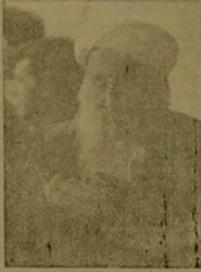
համադրվելու և միասնական դիտարկում: Այդ գաղափարը նա փաստարկված ձևով դիտում է յու հարցազրույցում, որը վեբերարի 22-ին երազարակվել է Դազախաստանի գործարար քաղաք-

ներկա «Զարավան» Երևանի քաղաք- քում: Մուլեյանովի կարծիքով, եվ- րասիայի երկու անկախ դիտարկում- ների դաշնից չունի և մոտ առա- ջայում չի ունենա յեղանակի այլըն- տան, քանի «սրտիկում ԽՍՀՄ-ում Դազախաստան և Ռուսաստանը ոչ միայն սարածով ամենամեծ հան- րադրություններն էին, այլև կազ- մում էին միասնական օրգանիզմ: Դա կազմավորումն ու զարգացու- մը տեղի էին ունեցել հարչարանակ- ների ընթացքում և այժմ այլևս քա- ժամանակ ենթակա չեն, ինչդեռ որ մարդու մարմինը միասնություն է կազմում գլխի, ողնաշարի և կեն- սականներն կարևոր մյուս օրգան- ների առկայությամբ: Նա համոզված է, որ Դազախաս- տանի և Ռուսաստանի բարձրագույն ղեկավարությամբ դա լավ է գնալու գում: Սակայն քանում է մտայն նախնակ չիլի ասակել «համադա- նարչային» քաղաք, փոխանակով «սկալ համադրվելու»: «Ներկայումս Դազախաստանում և Ռուսաստանում բոլոր զգաստ- մից մտղիկ դիտել է հասարակական մախարակով մեակեն միավորման ընթացք», գնում է Օլյա Մուլեյան- ովը: