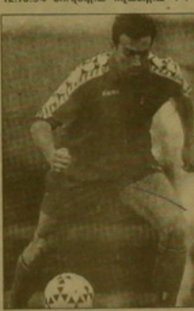
16.11.94 Քեյլանդիա-Լիտվանիա 0-4 16.11.94 Չեխոսլովակիա-Չեխոսլովակիա 0-0 14.12.94 Մալթա-Լիտվանիա 0-1 14.12.94 Չեխոսլովակիա-Լիտվանիա 5-0