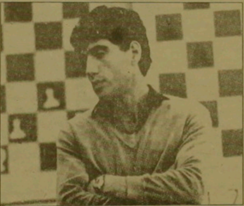
Տղամարդկային հավաքականի արդյունքները