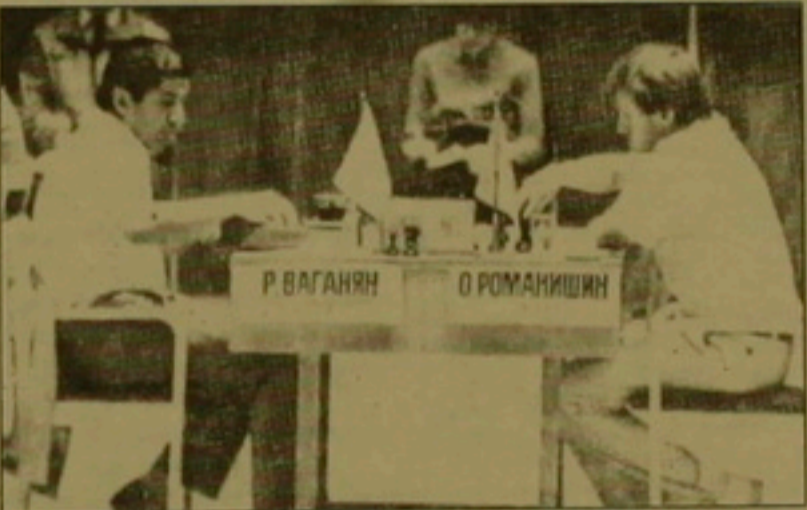
Անաստանի քիւմի հետ, Հայաստանի Եախմասխաճուկները 4-րդ տուրում մրցեցին Վրաստանի հավակնակնի հետ: Զավոմ, մեր քիւը դարձվեց 0-3 հավելով եւ զգալիորեն նահանջեց մրցաւարային արյուսակում:

յի հավակնակներին հետ գլխավորում էր մրցաւարային արյուսակը: Բանի որ օլիմպիադան անցկացվում է Եվրոպայական մրցակաղով, այսինքն առաջասարները մրցում են միմյանց հետ, 3-րդ տուրում 1.5:1.5 հավելով ավարտվով հանդիպումը