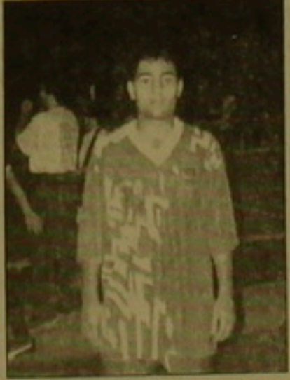
երկրորդ, 5 երրորդ): Դն թալցնում, ճողերիս հեղինակը Արթուր Պեճրոսյանին դրել էր առաջին ճեղում: Եւ իրով, ճաղանդավոր կիսադաճական իրեն

յասանի հավակնակնի կիսադաճական Արթուր Պեճրոսյանը, որը վասակնակ 42 միավոր (5 առաջին, 11