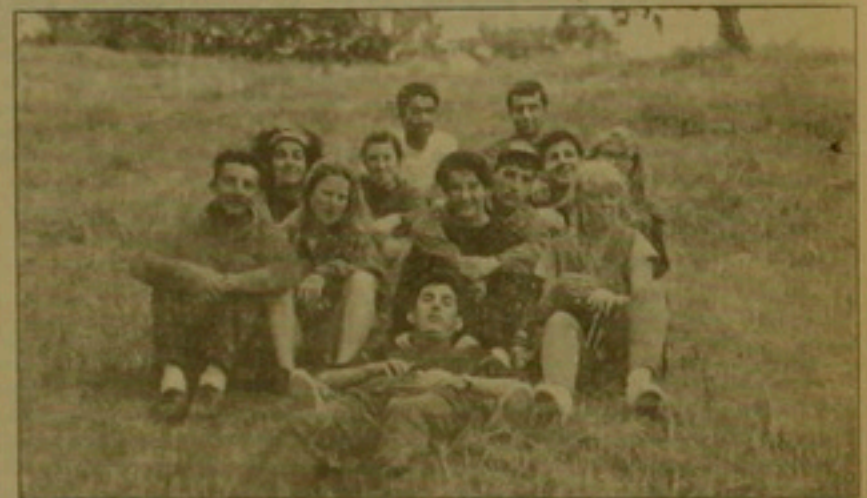
Ների կամավորների հեծախասանի միջազգային ճամբարներում: Արա սահմանային երկրներում հարգում եւ հաճվի են անում կամավորների գործունեությունը, նույնպես զարգացնում են սեղծումներ նրանց համար:

զումներ եւ վատարանների սեղադրում: Չնայած նախատեսվում էր ամռանը աշխատել այս միջոցառումը, բայց այն չի խզվել, եւ շարունակվում է 1400 միայնակ մարդկանց բժշկական եւ սննդային օգնությունը: Հաճվի ամեն լավ աշխատանքի եւ սոցիալական առաջնությունների նախարարության խնդրանքով, բժշկական ինստիտուտի սեկտորաչափ եւ ԵՏՄԻ վարչությունը որոշել են 95 ք. 2 րդ կուրսի բոլոր ուսանողների համար ուսումնական ծրագրի մեջ մտցնել ծերերին, հաճախումների եւ հաճախողանք երեխաների խնամքը, ծրագրի, որ ընդունված է երոդական