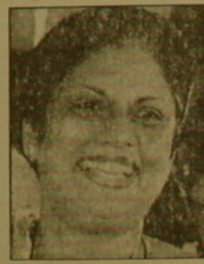
Կոմարտնովն, որը դարձավ առաջին կին նախագահը, այսօր հասել է ոչ միայն առաջին նախագահի բարձրագույն կենտրոն, այլ ինչպես նաև ֆալսափական կատարողության:

Այս սարխ օգոստոսին խորհրդարանային ընտրություններում հարյուրակ սարած եւ վարչապետի դաստիարակ Զանդիկա Կոմարտնովն զեռ չէր հասցրել տեղեկ հարկ Նա հարող ճանաչվեց նախագահական ընտրության համար: Տիկին Կոմարտնովն ՇԻՒՆԵԿԱյի դաստիարակ մեջ դարձավ առաջին կին նախագահը: Դա զարմանալի չէ, Շեյնի 49 ամյա բնակչային ներում է Բանդարանակի դաստիարակ սոնից, որի ներկայացուցիչները հայտնի են Կարախանական աշխարհում: Նրա հարող եւ մայր երկար ժամանակ կերպով գրադեղներ են կատարողության դեկալարի դաստիարակ: Աշխարհում վարչապետ դարձած առաջին կինը Միլիանո Բանդարանակին կարող է հորաբանալ իր դաստիարակությունը, որը ֆալսափականության դրկոն է, ազգաբնիկ սիրադեքում է անգլերենին ու Ֆրանսերենին, կատարում է բացահայտել կինի լեզվով, զերմաներենով եւ ռուսերենով: Չանդիկա Կոմարտնովն, որը դաստիարակության սարխների բուն կերպով հարողով էր մարխվում, այսօր հասել է ոչ միայն առաջին նախագահի բարձրագույն կենտրոն, այլ ինչպես նաև ֆալսափական կատարողության: