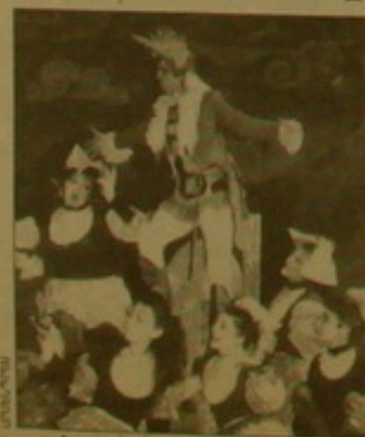
«Գալք քարե, շառ քարե» ներկայացումից

1993 թ. հունիսին, Մսրասքորի քառերի սեօրենը ընդառաջելով Գեղարվարչական գործունեության խանութական ընկերության հրավե-րին, եղավ Հայաստանում եւ սերուն ծանոթացավ քառերի գործունեու-թյանը: Վանաճորում հանդիպում ունեցավ Արելյան քառերի գլխա-վոր ռեժիսոր Վահե Կահիլյանի եւ նրա 48 դերասանների հեճ, նե-րկա եղավ «Երե՛մ քայ» քեմադրու-թյանը եւ հմայվեց դրանով: Ներկա-