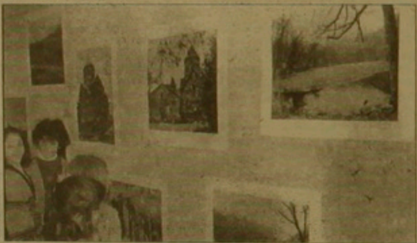
Մարտին Բեչեյանի փաթեթը

դարձնում հավերժական, ինչպես ինքը կյանքը: Գեղեցկության ան վերջանալի վերաստորելություն այդ սիրտը նրա նկարների փիլիսո-փայությունն է: Գեղեցկությունը մարդուն չի լքում նույնիսկ արեբա-կան դրաներին, վե՛րի ժամին, ֆանգի այն օրհնյալ է մեզ է տղամ ի վե-րուս: