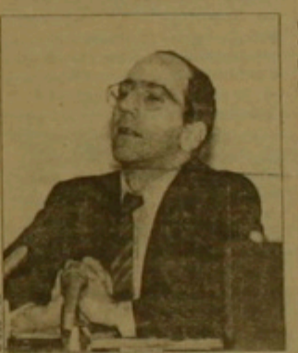
ԱՐԱՔԱՆՅԱՆ ԱՐԱՄ ԱՐԱԽԱՆՅԱՆ

Չորեքադրի զիճերն իր բնակարանի մոտի աղթե (Գադարի վ.), «Դեմ առ դեմ» հեռուստահարող ման ախարից հետո տուն վերադադնադիս, մի կանի անհայտ սղամարդ կանց կողմից բոր գործիճերով մեծի է ներարկվել հեռուստադարող Արամ Արախանյանը (նրաճեսագե, ՀՀ նախագահի մամուլի նախկին արադար, «Մամուլի տեսություն» հեռուստատեսային հաղորդադարի հեղինակ): Ուղեղի ցնցումով եւ դիմաճնոտային վնասադաճներով նրան սեղակադիտել են հիվանդանոց: