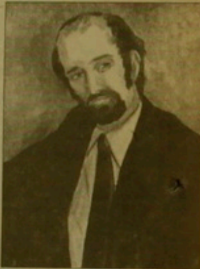
Քանասեղծ Ալբերտ Փարվանյանի դիմանկարը

«Մա ճճարհիս արվեստ է, իսկական գեղանկարչություն: Եւ ազգային է, եւ համամարդկային: Փարվանյանն ունի քի ստեղծելու քի ստեղծողի դիրքով ձեռն: Այստիսի արվեստը բոլոր ժամանակների համար է», այստես է գրել այցելուներից մեկը Փարվանյանի նկարները դիտելուց հետո, որոնք սեպտեմբերի 13-ից ի վեր ցուցադրվում են Հովհաննես Թումանյանի բանգարանում: