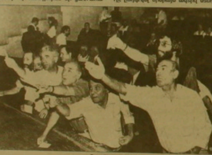
Գրողների միության արտաքին համագործակցություն

մանակալան մեկնել... Արցախի ծանաղալաններին ու ճակատային զոթում համախտ էի հանդիմում մի ցածրահալ