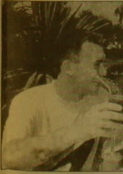
Գալֆայանը և Խասանայի անվան լողորդ Էտգոզեան

գանակակիր դարձավ լիսվալի Ռայմոնդա Մաժուլար (22.54 վրկ): Գալֆայանից առաջ էր նաև Կուսսալո Բուկար, (Բրազիլիա, 22.64 վրկ): Գալֆայանին, որը գտնվում է կիսնալի մարզավիճակում, ընդամենը 0.13 վրկ չբավարարեց մտնել խաղի դասում, սակայն երկուսուսուր լողորդի համար ամեն ինչ դեռ առջևում