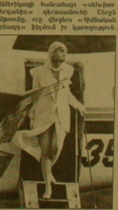
Մանսուրը և զեղեկությունը ժամանակակից ամբողջ աշխարհին, Կաս սիրահարներ ունի: Նրանցից մեկն է Բրազիլացի ան-

վանի ֆուտբոլիստ, Բրազիլիայի հավաքականի դաստակարան, աշխարհի չեմպիոն Մարսիո Մանսուր: Կերպիս ի սպալան «Ֆիորենտինա» թիմում խամբայնել է խաղալ միայն այն դասում, որ իրեն ծանոթացնեն Երբն Սքոունի հետ: «Ֆիորենտինայի» նախագահ Վիկտոր Զեկկի Գորին, իսպաղուն հասուկ ճարտարություն գործադրելով աշխարհի յոթ մայրերում ու նաև կինոյի աշխարհում իր կառույցը, Մանսուրին խոստացավ ծանոթացնել Երբն Սքոունի հետ: Բայց Գորին մեծ դաս ման դրեց ծանոթության համար, քս որի, Մարսիո Մանսուրը մրցաբարի ընթացքում դեռ է խփել անվազն 7 գնդակ ֆեդերացիայի, որ Մանսուր դաստակարան է եր նա համար ուղարկողի դաստակարանը դավար կլինի: Զեկկի Գորին շարունակել է իր ստեղծ, ավելացնելով, որ Երբն Սքոունն իր բարեկամությունները մեկն է եր համաժողովը ֆիլմ դեռ է դաստակարանը ևս: «Ֆիորենտինայի» հետ եր այս մրցաբարում մարզադասերի սարձմենը մի օր հասնի իր երազին: Գ. Ա.