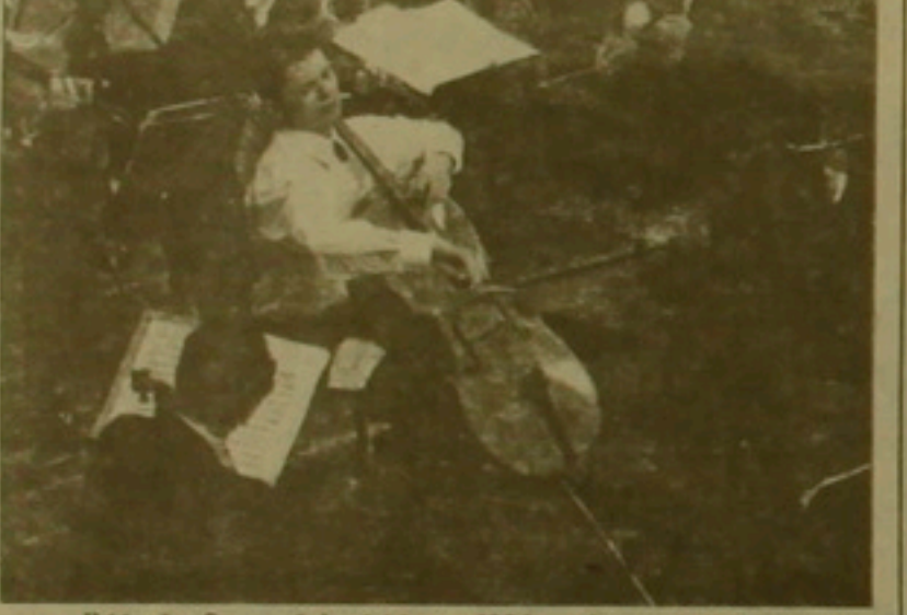
Ավելի հարուստ եւ ուժեղ. 1994 թ. «Չառուբեր» նվագախումբի կազմակերպումը:

Մեր քերթի երկրի համարում տարածվել է «Չառուբեր» նվագախումբի կազմակերպումը: Նոր սերունդը համագործակցության շրջանակներում կարողանա իրենց ցուցաբերել: