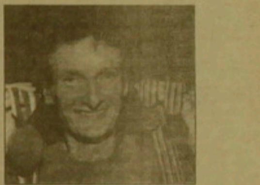
Ջոն Կյուրին որդու մեղալիներով

Անգլիալ առաջին անվանի գերաստիտը Ջոն Կյուրին 44 տարեկան հասակում վախճանվեց սոցիոլոգ: Մահից առաջ Ջոն Կյուրին, որը մի համեստ բնանիւրի զավակ էր, ուզում էր իր մոր Ռիտա Կյուրիի աղբուրան աղախովելու համար անուրդի հանել չեմպիոնական մեդալները եւ գոյացած գումարները համեմել մորը: Բայց Ջոն Կյուրին շուտով մահացավ: Երեք տեղի մեղալիներ, որ 1976 թվականին Ջոն Կյուրին նվաճել էր Եվրոպայի առաջնություններում եւ օլիմպիական խաղերում, վաճառվեցին: Այս դասադասությունը շատ արագ հարուստ մի անգլիացու վրա: Իրանես Բարսանունով այդ անձնավորությունը վաճառված մեղալիները եւ գնվելով