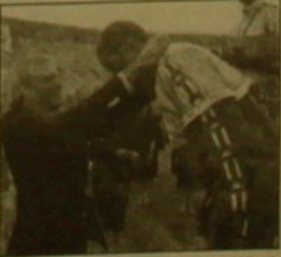
Թեղ թերները զարգեցրել է հանձնարարական «Քարի կամփ» խաղերի ծրագրով:

1980 թվականին Թեղ թերները մեջեղ էր թերում ՍիՆԵՆ հանրահայտ հե-