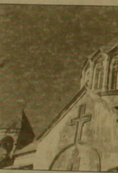
Կոմիտասի ու կյանքի մի օազիս, շուրջը մահ ու ավեր

նագիտական, սեճսական, մեակոթ, իսկ ցեղատյանությունն նոր փորձ-երի դեղինում նաեւ ռազմական ան-բողջ հզորությամբ, քաղաքակրթա-կան միջազգային կեռով եւ առաջ-հաճած գաղափարների քաղաքակր-թայնությամբ»: