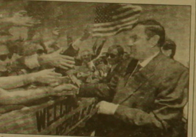
Օգոստոս 14. Լեոն Տր-Պետրոսյանը Լուս Անջելեսի միջազգային տղակայանում:

մից: Այնուհետև Վրաստանի անկախութեան, նախագահը ըստ: «1994