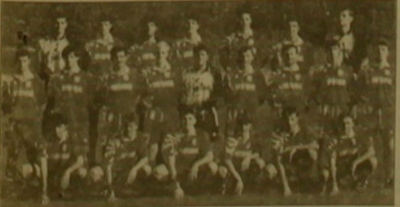
Քուլդարիայի ՔԿՄԱ թիմը

Անհաջողության գլխավոր պատճառը զգանքների անկործանելիքն էր: Որոշ խաղացողներ կորցրեցին իրենց, հասկացրին դաստիարակվելու ժամանակ: Կարող եմ նեղ Մկրտչյանին: Դասեցից հեռացվեցին մեր երկու խոստովանները Տոնոյանն ու Քոչարյանը: 2-րդ կեսի 4-րդ րոպեները կամ խուճուրդի հիմնարկությունները, բանկային համակարգը, «Քաղկան տուրսը», ավիացիոն ընկերությունները: Վերջիններս համարվելով ՔԿՄԱ վարչության անդամ կազմակերպություններ, ցածր հարցերով սասար են կանգնում նրան: Թիմը հեծությունը ընդունում է մրցակիցներին և կազմակերպում իր ուղեւորությունները: Այնուամենայնիվ, մեր խաղից առաջ ՔԿՄԱ-ն էլ ներքին խնդիրներ ուներ: Աշխարհի առաջնությունից առաջ, Քուլդարիայի ազգային հանդիպմանը և խուճուրդի հիմնարկությունները, Քուլդարիայի ցածր գնահատվելու և խուճուրդի հիմնարկությունները, Քուլդարիայի ցածր գնահատվելու և խուճուրդի հիմնարկությունները: