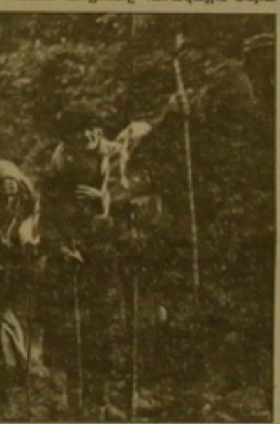
ՕՆՈՒՆԻՆԵՐՆ ՈՒ ԵՐԵՄԱՆԵՐԸ:

Վերջին տարիներին Վրաստանում կատարված փաղափակման ու օգտակար քոլոր իրադարձությունների ընդհանուր արդյունքը Զարավային Օսիա