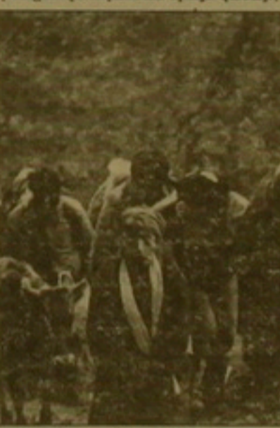
ՕՆՈՒՆԻՆԵՐՆ ՈՒ ԵՐԵՄԱՆԵՐԸ:

տորների զնախասումների համաձայն, հենց այդ գործունի կիրառման դեղում կարող է ստացվել այնպես, որ Արխագիա վերադասնալ միայն կանայք,