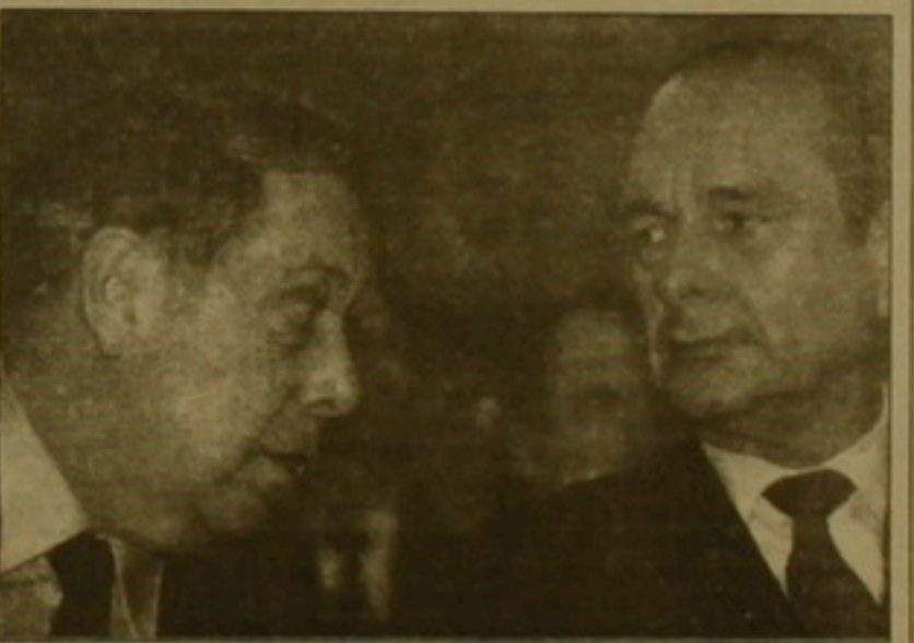
Մարդու իրավունքների դաստիարակություն՝ Ֆրանսիական ձեռով

ստեղծում նեմարված ճգնաժամը նրա նախագահի թեկնածության դասժառով քարեհաղորդությանը լուծվեց՝ առաջիկա հինգ արում հանձնաժողովը կնախագահի կուստնորդի այժմյան վարչապետ ժակ Մանսերը: Երեք շաբաթ առաջ Երամիության վերնախավում շեղի ունեցած հանդիպման ժամանակ Բելգիայի վարչապետ ժան-Լյուկ Դեանը չէր խանգարում Բրիտանիայի վարչապետ Տոն Սեյլորին, եւ նա օգտագործելով վեռնի իրավունքը, բոլորին դեմ գնաց, որը եւ սեղծեց կարգու: Սակայն հուլիսի 1-ին Եւրոպական միությունում նախագահական կեսարվա հերթավորիսն անցած Դասնակցային Գերմանիայի կանցել Գեյմուս Քոլը առաջարկեց մի նոր թեկնածու, որը միանգամից բոլորի սրով եղավ: ՅՑ ամյա ժակ Մանսերի կերպարանը Եւրոպական հաղաբական թեմում վաղուց է հայտնվել: Բազմակողմա-