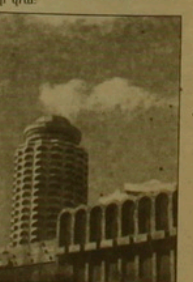
Ըստ նախնական գնահատմաների Երևանի քաղաքում կարծես 6-8 միլիոն դրամ: Յիմանալորումը ղեկ է ստանձնի ղեկությունը, քանի որ մեկուկուսուկուս աղաքասարդությունը նման միջոցներ չունի:

հիմնականում 21 հարկանի հյուրանոցում աղաքասանած գաղթականների վրա: