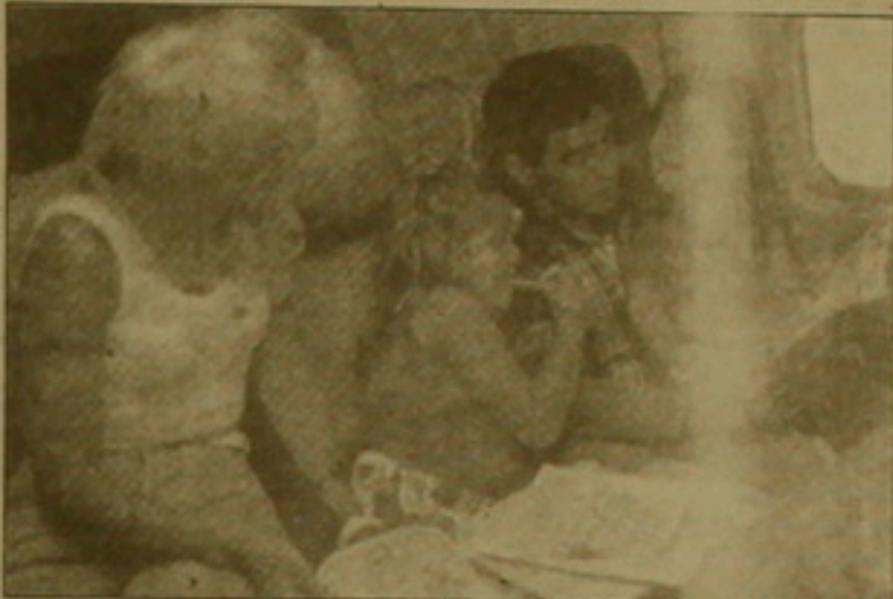
Մարադոնան կնոջ և երեխաների հետ

կին 2 խաղով: Լավ խաղալու համար ես երբեք ղեկն չեմ կարծի չեմ գտնում, բայց հիմա իմ նպատակը կհասնի: Ես ուզում եմ Արգենտինա վերադառնալ չեմոլիստի տիտղոսով եւ իմ երկրպագուներին նվիրել աշխարհի գավաթը: Ֆուտբոլն ինձ համար