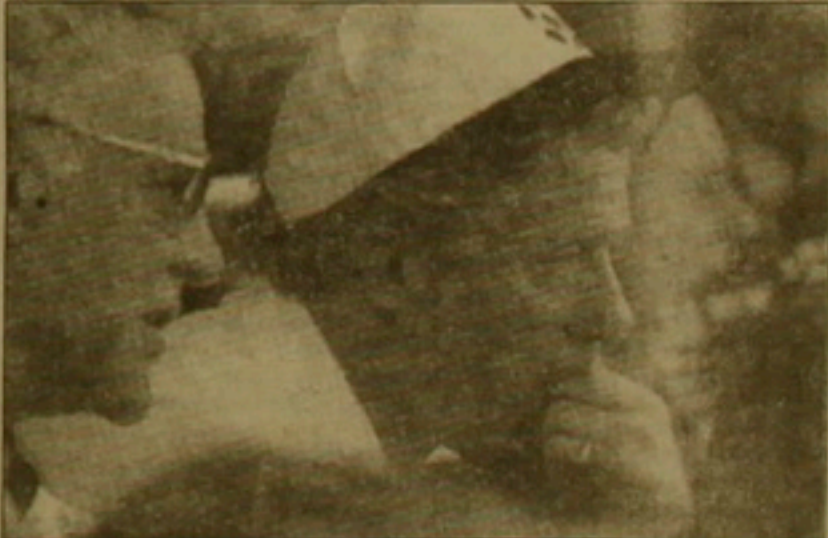
Բիլ Զինթոնը Գերմանիա-Ռուսիա հանդիպման ժամանակ

Նրա աղջիկը Վաշինգտոնի դպրոցներից մեկի թիմում խաղում է, իրեն դարձաբասկետ: Ամերիկացիները չեն