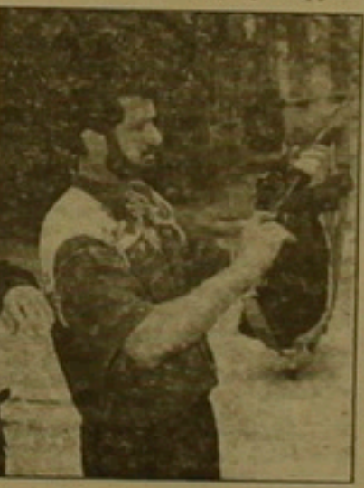
Վերաբերումները միանգամայն կերպով նույնն է այդ բոլոր ժողովուրդների հանդեպ:

ի լուծման բանալին, անհույս, գնվում է Մոսկվայում: Ռուսաստանի ղեկավարության