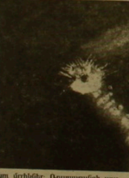
կու մոլիկներ: Ռուսաստանի աս- դագետներն արձանագրեցին դրանք: Ակադեմիկոս Ժորտովը ասաց

նուրսի բարձրումներով եւ առաջա- նում 2-5 հազար կմ-ի հասնող հոս- ման, որ Յուղիների վրա բծերի հայտնվելու դառն, դրանց չափը եւ