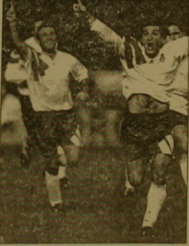
ԼՈՒՅՐ ՄԱՅԵՌՈՒ (Գերմանիայի հավաքականի ավագ)

ՔՈՂՈՒ ԼԵՂՆԵՐ (Գերմանիայի հավաքականի դարձույթադաս). «Խաղը մեր հաղթության սակ է: Մեզ անակնկալի քերեց Սոխիկովի գոլը: Ես հեռանում եմ հավաքականից: Ուզում եմ կենտրոնաղալ ալորմում եւ հարքել ՈւեՖԱ-ի մրցաբարում, բայց կուզենայի հեռանալ աշխարհի չեմպիոնի կոչումը նկանամ»: