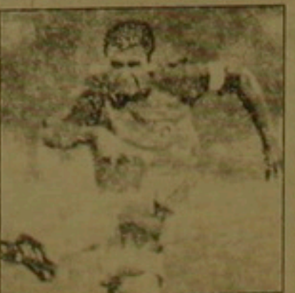
Կարի կերպարներից մեկը: Նա այսօր այնույնիսկ խաղ է ցուցադրում, ինչպես 1990 թ. Իսպանիայի աշխարհի առաջ-

Աշխարհի առաջնություն խված 3 գոլերից եւ կատարած 3 գոլային փոխանցումներից ու գերազանց խաղից հեռու Ռուսիայի հավատակաճի ավագ Գեորգի Դաջին դարձել է մրցա-