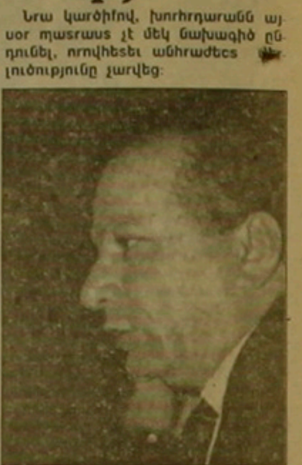
Բարկեն Արաղցյանը համաձայն էր, քի կարելի է մեղ նախագծի ընղղունման դեղղում ինչ-որ կարգավղեղակ սաղ այղ հանձնաձեղողղին, քայց ոչ մի դեղղում այն չիամարել նոր դասգամավորներով: «Երե երեղ նախագծին էլ ընղղունղի, աղաղ խորհրդարանն ինղ կրողղի հաղաղ անղիղը», աղաց նա:

«ԻՆչ քան է ընսրական համակարգը, այս մասին այստեղ չխոսվեղ» այս ողես ընուրթաղեղ Գերագույն խորհրղի ընսրությունների մասին օրեղի ցնհարկումը Գերագույն խորհրղի նախագահ Բարկեն Արաղցյանն իր եղրակակիզ եղուրղում: Նրա ասելով, իրեն չեն գողացնում քիկացյաղ խաղաղ դայաններում անցնող ցնհարկումները, երղ դասգամավորներն ավելի շաղ ուղաղություն են դարձնում երկրորղական և ոչ իղնական հարցերին: Նա նեղ, որ Գերագույն խորհրղի նախագահողություն նախաձեղողությունը սեղծված հանձնաձեղողղ ոչ մի կարգավղեղակ չուղի: Գանձնաձեղողղ օղսաղործել է երկու նախագծի, որը դասրասուղել է անկաղաղեղականողություն հանձնաձեղողղի կողմից: Բարկեղ Արաղցյանի ասելով, այղ նախագծերն սկզբուղնային սարքեր մոնսցումներ են ներկայացնում, և խորհրդարանը դեղս է ցնհարկել, քի դրանցից որը է վաղղաղ Գայասանի համար ավելի իմաստակոլղած: Մինղղես աղաղարկ եղավ երեղ նախագծերն էլ սաղ հանձնաձեղողղին՝ դրանցից մի ընղղահանուր նախագծի մակեղու համար: «Ովեր ողղում են դեղկավարել այղողղիսի հանձնաձեղողղով, որը կգնա երեղ նախագծի վրա կաղաղաղի, կարող են իրենց քիկնամողությունները դեղել, այստեղ ընսրել: Ես համեղենաղ դեղս, այղողղիսի գործողղ չեղ գրաղղղի», կսրուկ հայտարարեղ խորհրդարանի նախագահը: