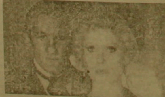
«Վերջին մեհրություն» կարին Դեյնյովը Մարիոն Երայների եւ Ժերար Գեդարյոյնի հետ: Փոփոխությունները:

Մոնմարտի քաղաքի դասերակական տարիների կյանքի, նրա դերասանների, հայտնի դերասանուհի Մարիոն Երայների եւ դերասան Բեռնար Գրանժեի սիրավեպի մասին: Գլխավոր դերերում նկարահանվել են Կարին Դեյնյովը, Ժերար Գեդարյոյն, Ժան Պուարեն, Գայնգ Բեները եւ բաց այլ հանրահայտ դերասաններ: Ֆիլմը նկարահանվել է 1980 թ. եւ ներկայացնում է հակաֆաշիստական ու իրենախաբույրություն, իրենների հեղափոխում ֆաշիստների կողմից: Մարիային ամենամոտ զգացմունքներն ու կերտարների հակասակաբություն, որը եւ բալետական հուզիչ եւ հանդիսատեսի համար: